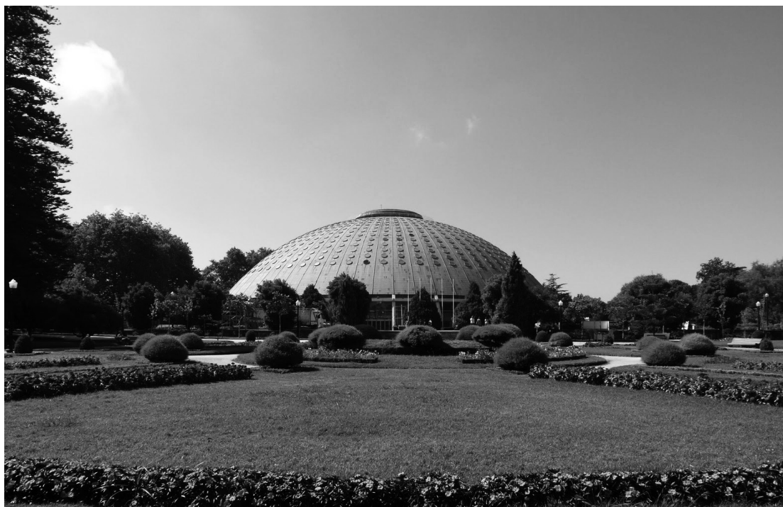
Palácio de Cristal, actualmente Pavilhão Rosa Mota, no Porto, onde se realizaram 5 edições do Campeonato do Mundo.