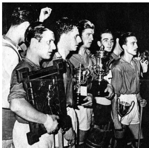
Equipa da Espanha Campeã Mundial.