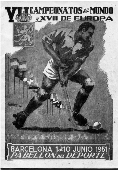
Cartaz do Campeonato.