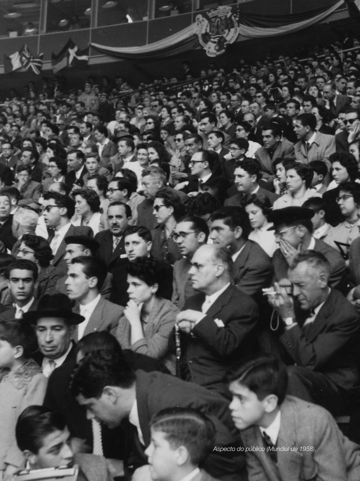
Aspecto do público (Mundial de 1958).